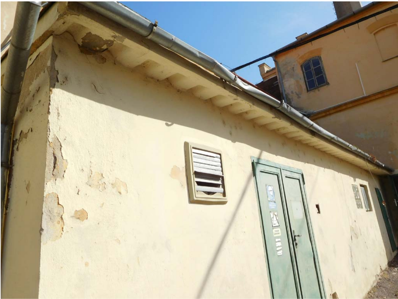
DETAIL STŘEŠNÍHO ŽB PREFABRIKÁTU