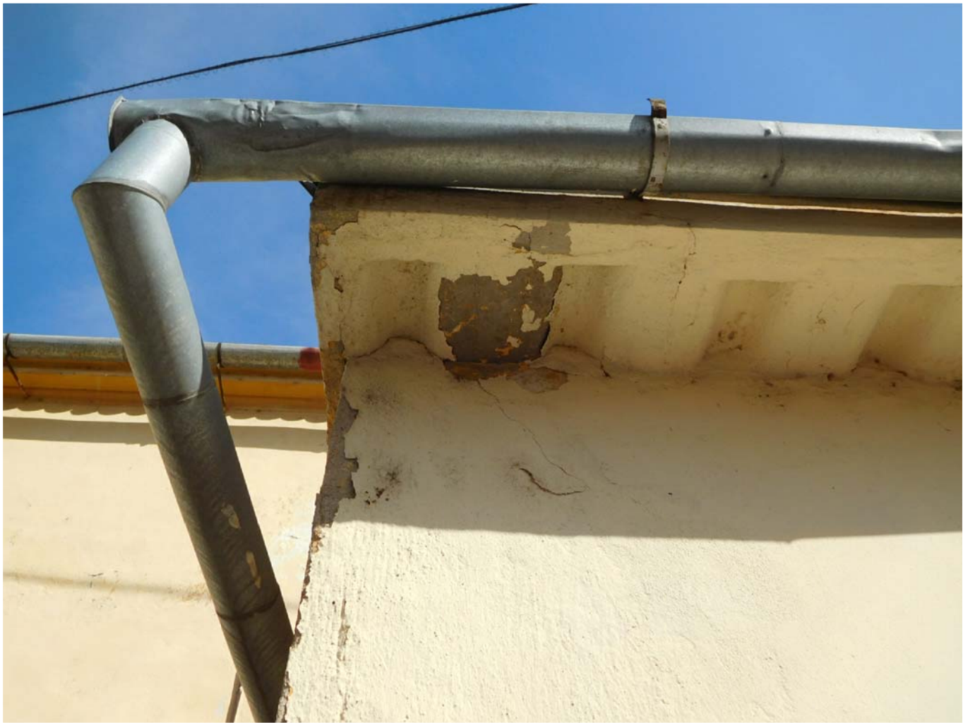
DETAIL STŘEŠNÍHO ŽB PREFABRIKÁTU (NÁROŽÍ)